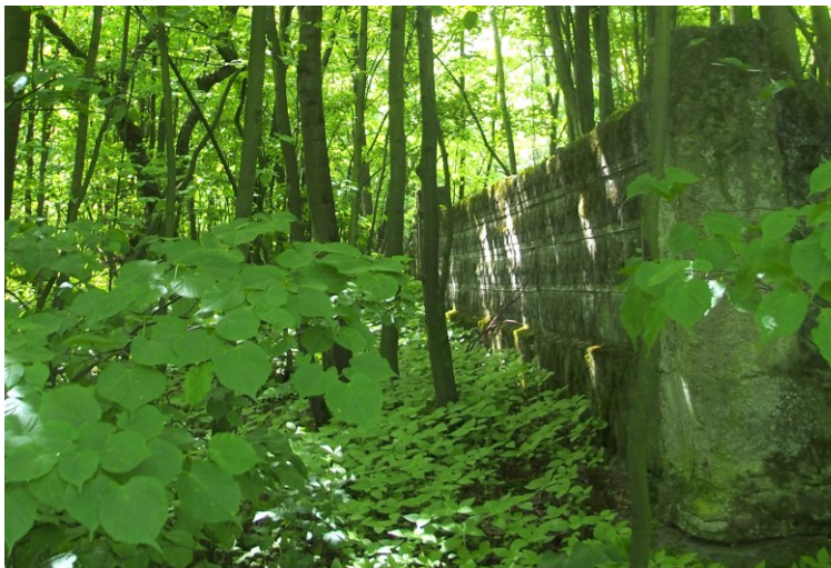
Widok od północnego-wschodu

7. Fotografia z opisem wskazującym orientację w stosunku do sąsiednich terenów lub stron świata albo mapa z zaznaczonym stanowiskiem archeologicznym