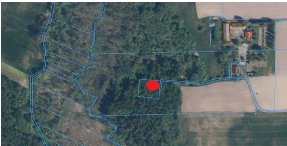
Mapa obrazująca lokalizację obiektu