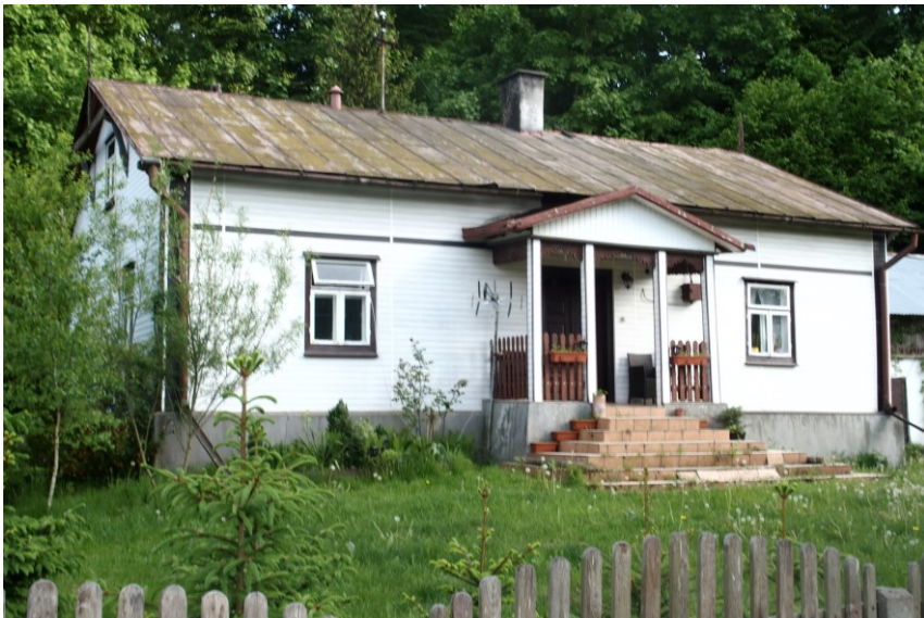
Widok budynku od północy

7. Fotografia z opisem wskazującym orientację w stosunku do sąsiednich terenów lub stron świata albo mapa z zaznaczonym stanowiskiem archeologicznym