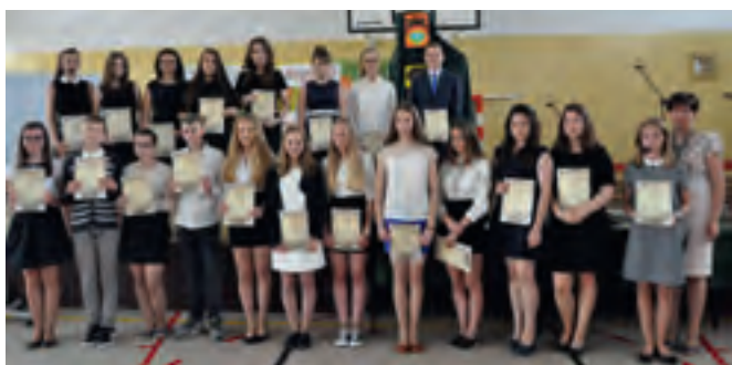
Stare Proboszczewice – stypendyści naukowi – Gimnazjum