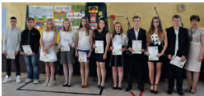
Stare Proboszczewice – stypendyści sportowi – Gimnazjum