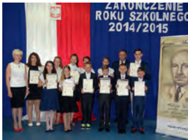
Wyszyna – stypendyści naukowi