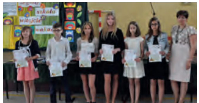
Stare Proboszczewice – stypendyści sportowi – Szkoła Podstawowa