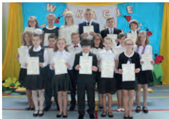
Stara Biała – stypendyści naukowi