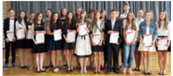
Maszewo Duże – stypendyści naukowci - Gimnazjum