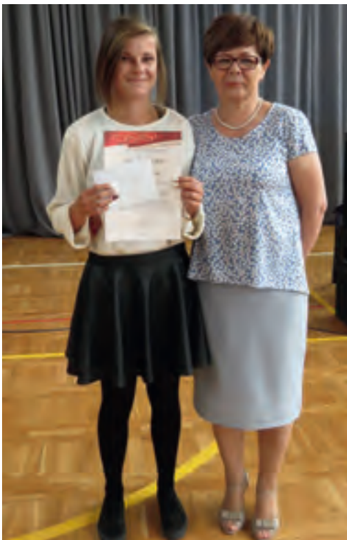
Maszewo Duże – stypendium sportowe