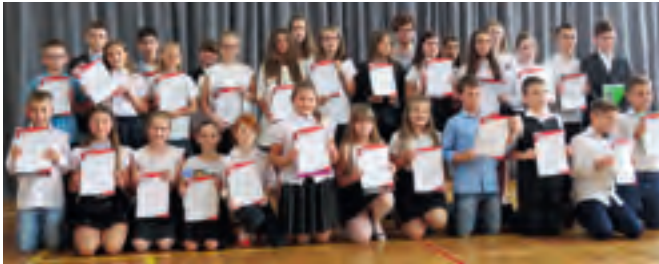
Maszewo Duże – stypendyści naukowci - Szkoła Podstawowa

Stypendium za dobre wyniki w nauce otrzymał uczeń, który w semestrze poprzedzającym przyznanie uzyskał średnią ocen co najmniej 4,75 oraz co najmniej dobrą ocenę z zachowania. Stypendia są jednorazowe i wynoszą po 200 zł.