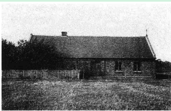
Kantorat zu Bronowo mit Betsaal