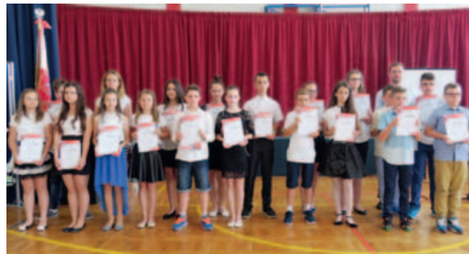
MASZEWO - stypendyści klasa V