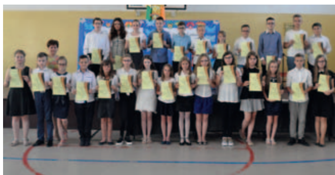
PROBOSZCZEWICE - stypendiści nauka sp