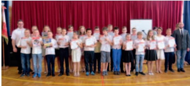
MASZEWO - stypendyści klasa IV

Stypendium za dobre wyniki w nauce otrzymał uczeń, który w semestrze poprzedzającym przyznanie uzyskał średnią ocen co najmniej 4,75 oraz co najmniej dobrą ocenę z zachowania. Stypendia są jednorazowe i wynoszą po 190 zł.