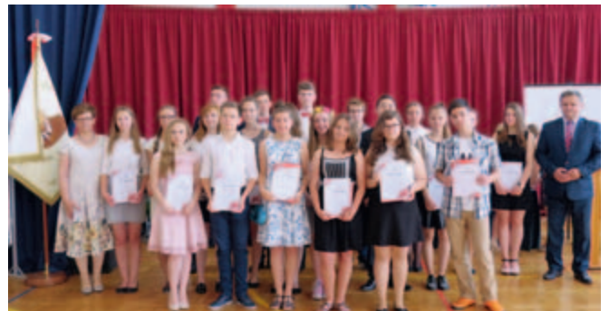
MASZEWO - stypendyści gimnazjum