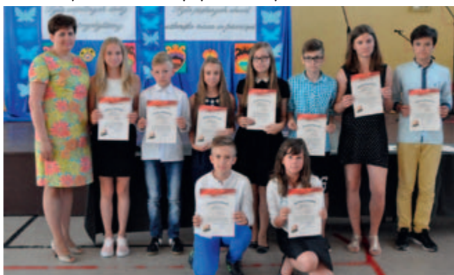
PROBOSZCZEWICE - stypendiści sport sp