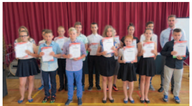
MASZEWO - stypendyści sportowe