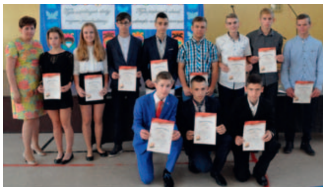
PROBOSZCZEWICE - stypendiści sport gm