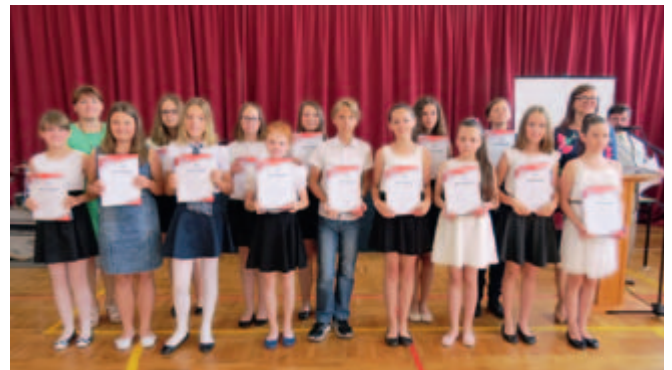
MASZEWO - stypendyści klasa VI