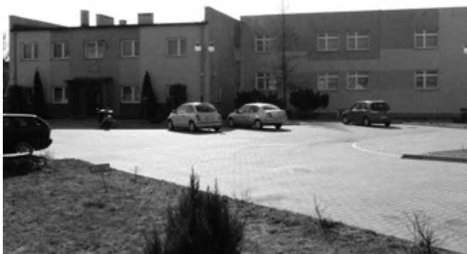
Oświata to największy gminny wydatek

Subwencja oświatowa, czyli 7 853 674 zł jest to kwota jaką budżet państwa przeznacza na utrzymanie naszych szkół podstawowych i gimnazjów. Subwencja wyrównawcza (451 775 zł) to rekompensowana przez budżet państwa likwidacja podatku od posiadania przez nas samochodów osobowych. Udział w podatku dochodowym od osób fizycznych to 6 551 205 zł i stanowi 37,26 proc. podatku jaki płacimy od naszych dochodów osobistych tzw. PIT do Urzędu Skarbowego.