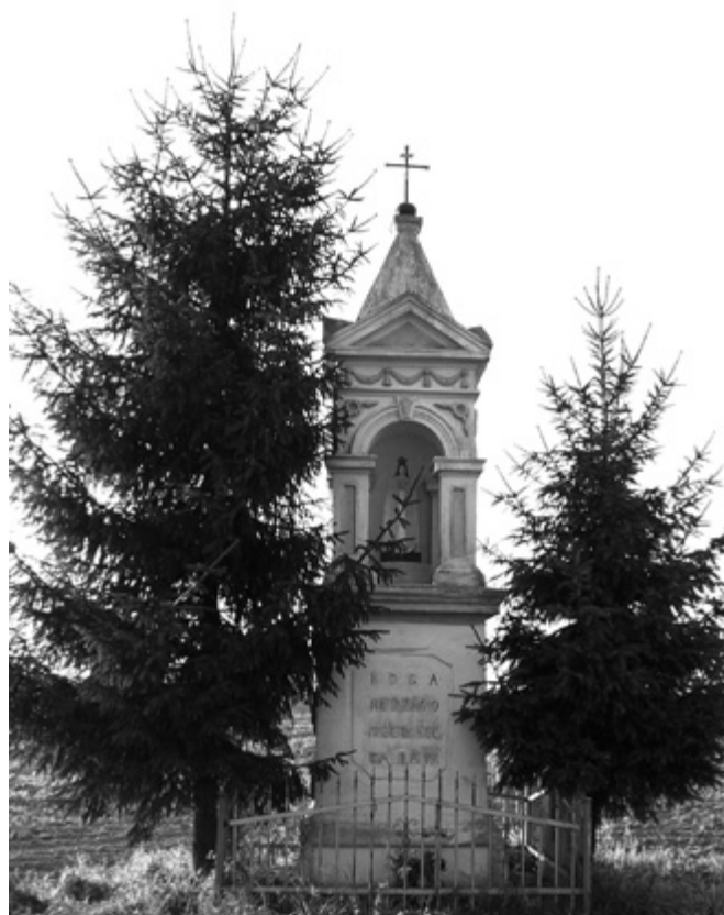
Najbardziej okazała i jedna z najstarszych kapliczek w naszej gminie