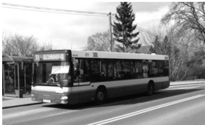
Dopłata do komunikacji miejskiej to także istotny wydatek

to kwota 650 tys. zł, w tym od osób fizycznych czyli rolników indywidualnych ok. 600 tys. zł. Ok. 220 tys. zł to podatek od samochodów ciężarowych. Dosyć istotną pozycją jest podatek od tzw. czynności cywilnoprawnych, który wynosi 330 tys. zł. Są to podstawowe dochody budżetu naszej gminy. Nie możemy wymienić wszystkich drobnych wpływów, które nie mają jednak istotnego wpływu na ostateczną wielkość budżetu.