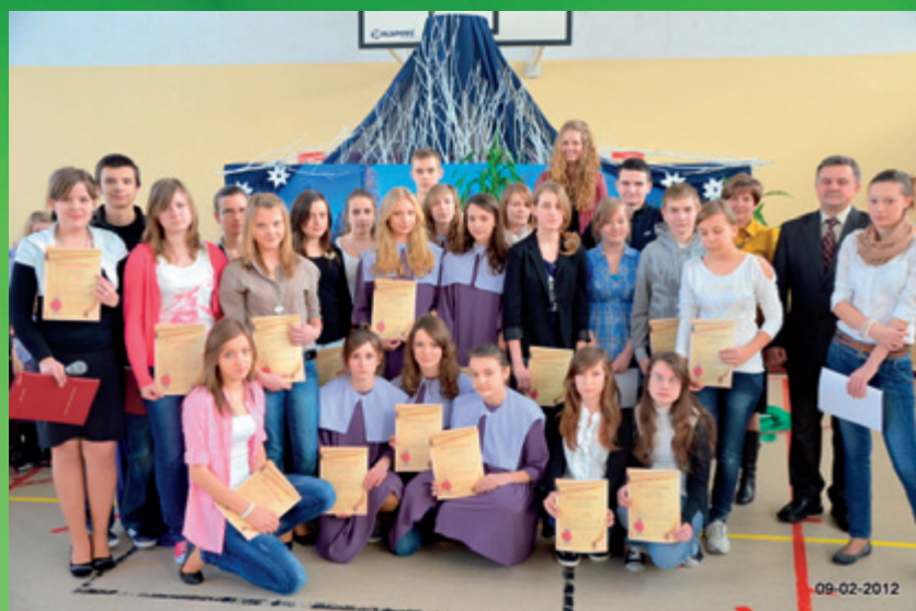
Stypendyści za wyniki w nauce z Gimnazjum w Starych Proboszczewicach