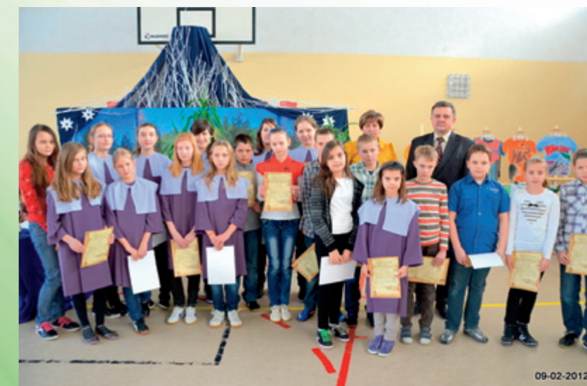
Stypendyści za wyniki w nauce ze szkoły podstawowej w Starych Proboszczewicach