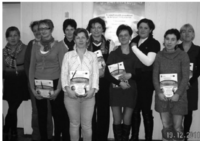
Panie biorące udział w projekcie podczas jego podsumowania otrzymały stosowne certyfikaty