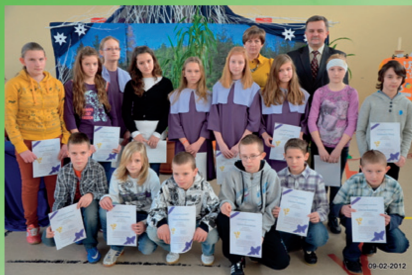
Stypendyści za wyniki sportowe ze szkoły podstawowej w Starych Proboszczewicach