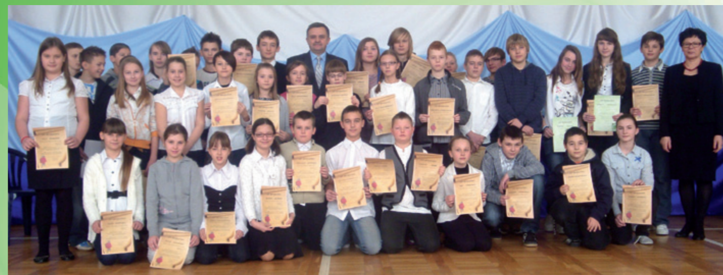
Stypendyści z Maszewa Dużego