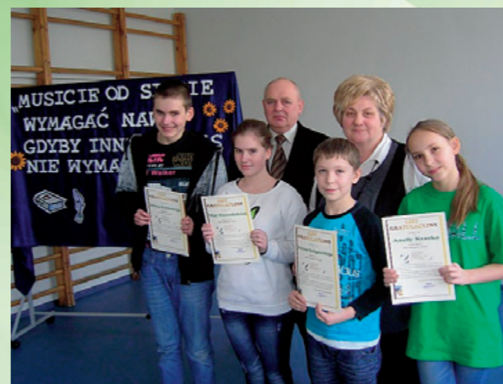
Stypendyści z Wyszyny