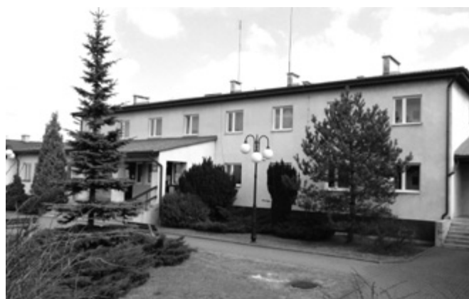
Docieplenie budynku UG to koszt prawie 278 tys. zł

z Funduszu. W sumie gmina otrzyma z Funduszu 794,8 tys. zł pożyczki. Tego typu kredyty są zazwyczaj nisko oprocentowana i często w części ich spłata jest umarzana.