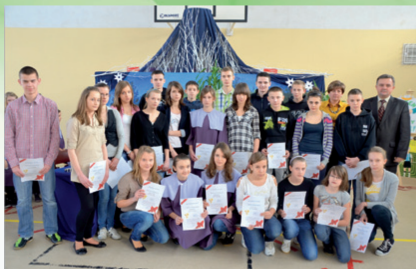
Stypendyści za wyniki sportowe z gimnazjum w Starych Proboszczewicach