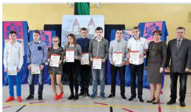
Stypendia sportowe Gimnazjum w Starych Proboszczewicach

W gimnazjum w Starych Proboszczewicach stypendia