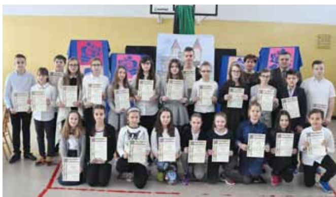
Stypendia naukowe Szkoła w Starych Proboszczewicach