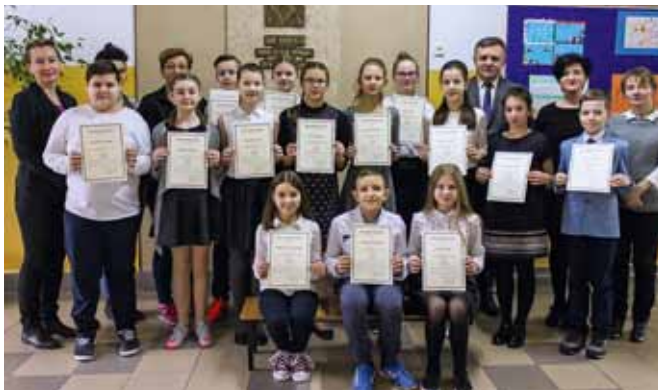
Stypendyści Szkoła w Starej Białej.

Stypendium za dobre wyniki w nauce otrzymał uczeń, który w semestrze poprzedzającym przyznanie uzyskał średnią ocen co najmniej 4,75 oraz co najmniej dobrą ocenę z zachowania.