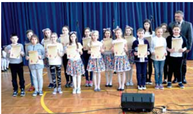
Stypendyści Szkoła w Maszewie Dużym kl.IV