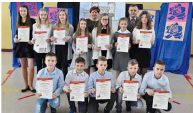
Stypendia sportowe Szkoła w Starych Proboszczewicach