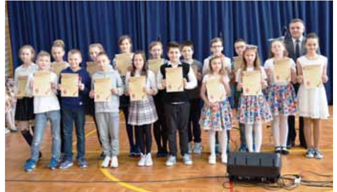
Stypendyści Szkoła w Maszewie Dużym kl.V