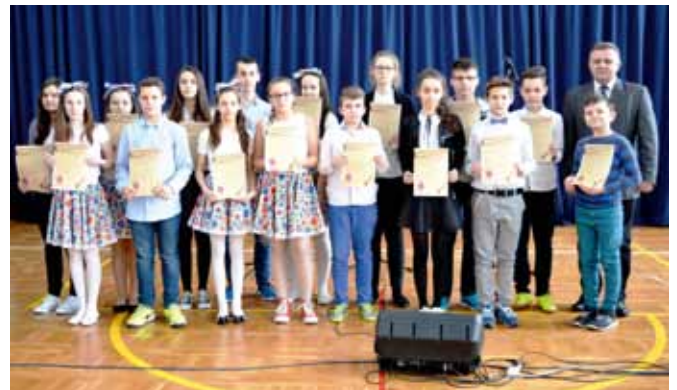
Stypendyści Szkoła w Maszewie Dużym kl.VI