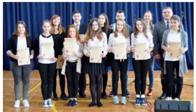
Stypendyści Gimnazjum w Maszewie Dużym.