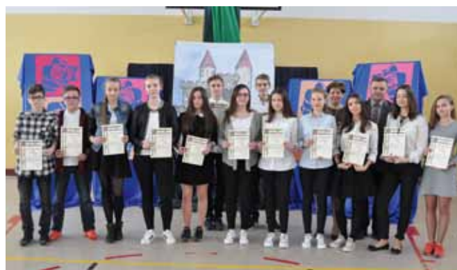
Stypendia naukowe Gimnazjum w Starych Proboszczewicach