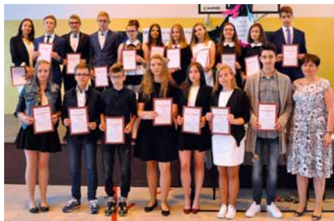
STARE PROBOSZCZEWICE - stypendyści nauka gm