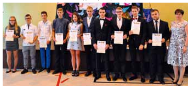
STARE PROBOSZCZEWICE - stypendyści nauka sp