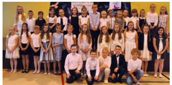
STARE PROBOSZCZEWICE - stypendyści klasy II - III