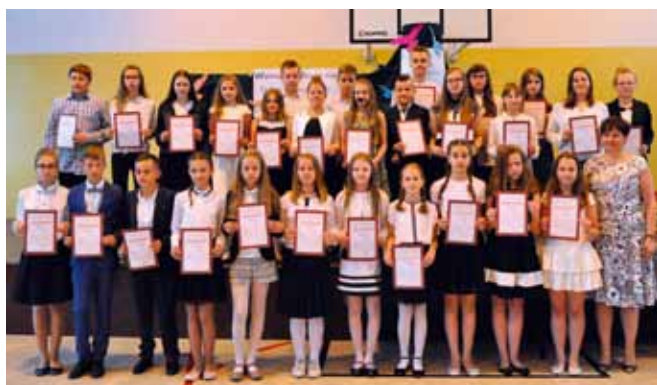
STARE PROBOSZCZEWICE - stypendyści nauka sp