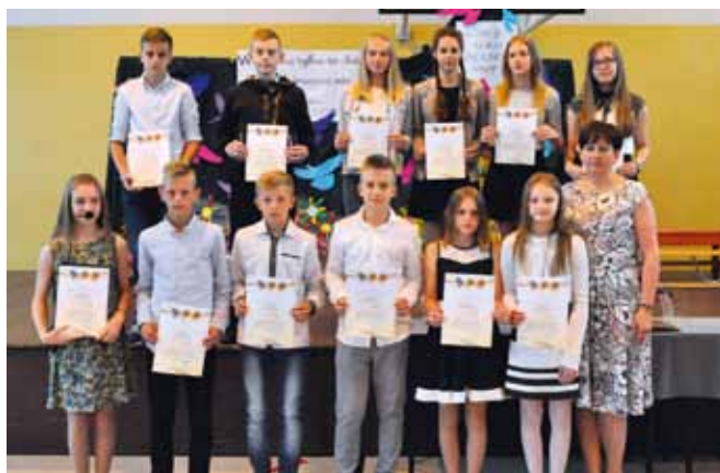
STARE PROBOSZCZEWICE - stypendyści sport sp