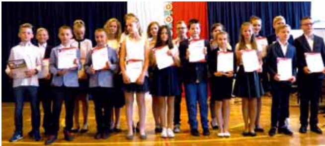
MASZEWO DUŻE - stypendyści klasa V