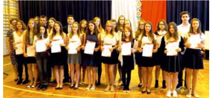
MASZEWO DUŻE - stypendyści gimnazjum