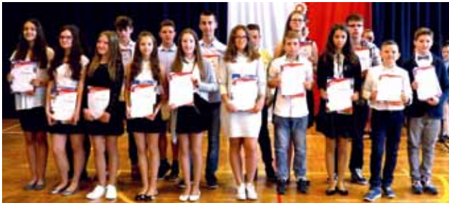
MASZEWO DUŻE - stypendyści klasa VI

Stypendia naukowe otrzymali uczniowie ze średnią ocen powyżej 4,75 i z co najmniej dobrym zachowaniem. Sportowe otrzymali ci, którzy mogą pochwalić się sukcesami na zawodach i turniejach.