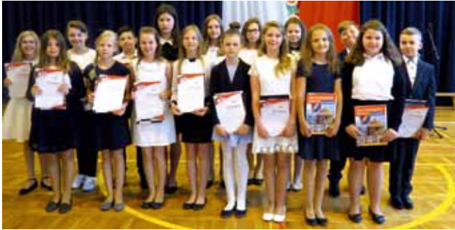
MASZEWO DUŻE - stypendyści klasa IV