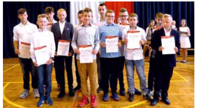
MASZEWO DUŻE - stypendia sportowe