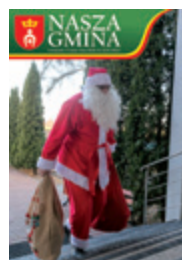
Okładka: Święty Mikołaj w drodze do dzieci z Maszewa Dużego