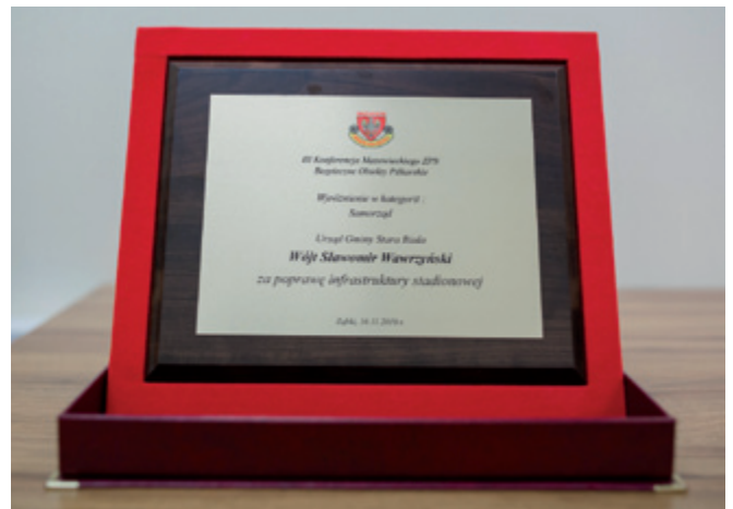
Pamiątkowa plakietka „za poprawę infrastruktury stadionowej”