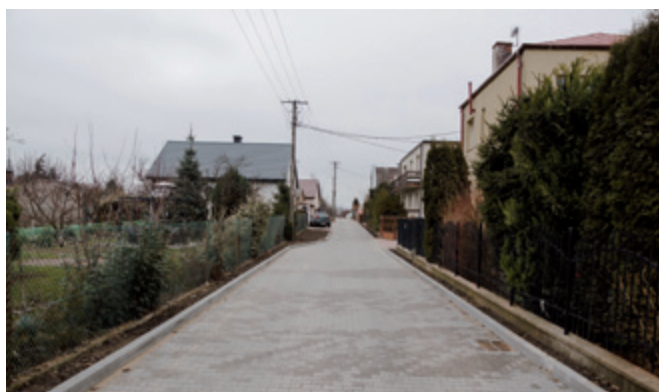
Ulica Agrestowa w Maszewie Dużym

W ramach ogłoszonego w lipcu przetargu „Budowa ulic w miejscowości Maszewo Duże” wykonane i odebrane zostały dwa zadania „Budowa ulicy Agrestowej o długości 17,5 m i budowa ulicy Bukowej o długości 196 m w miejscowości Maszewo Duże”.