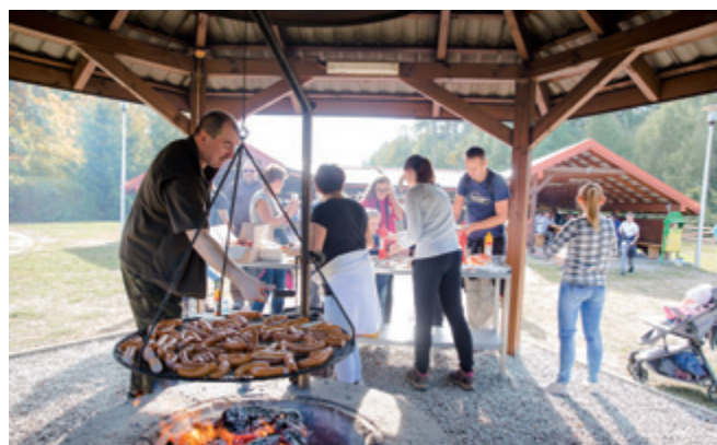
Kielbasek z ogniska nie zabrakło dla nikogo