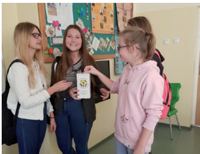
Zbiórka wśród uczniów szkoły w Maszewie Dużym.

Wolontariusze zebrali w szkole 174,44 zł.