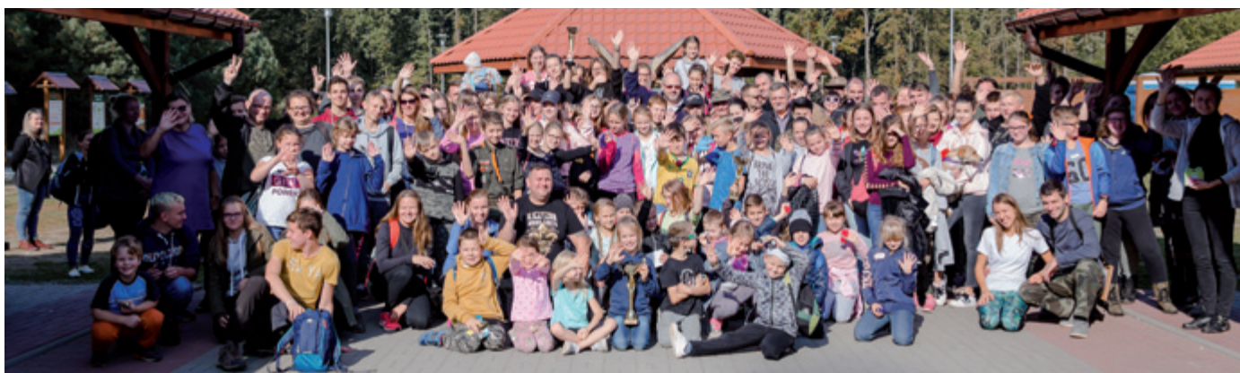
Wszyscy uczestnicy rajdu