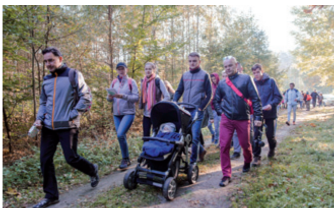
Najmłodszy uczestnik rajdu

Jak co roku organizatorem rajdu był Gminny Ośrodek Kultury i Sportu w Starej Białej oraz Nadleśnictwo Płock. Nad bezpieczeństwem uczestników czuwali strażacy z OSP Brwilno. Pomysłodawcą oraz realizatorem technicznym rajdu było Stowarzyszenie Tradycjonistów z 1 Maszewską Drużyną Harcerzy ZHR „Białe Wilki” oraz Szczepem Harcerskim ZHP „Alvarium” z Płocka.