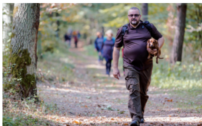
Na dwóch nogach wygodniej niż na czterech