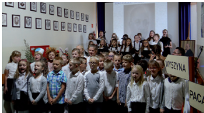
Najmłodszy chór w Wyszyńce