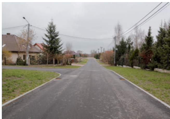
Ulica Lawendowa w Brwilnie

W październiku br. zakończyła się realizacja inwestycji pn. „Budowa ulicy Lawendowej w miejscowości Brwilno”. Wykonany ciąg główny wraz z najdłuższym sięgaczem ma długość 686 m i posiada nawierzchnię bitumiczną. Cztery sięgacze ulicy Lawendowej zostały wybudowane z kostki betonowej. W zakres zadania wchodziło również wykonanie kanalizacji deszczowej, zjazdów do posesji oraz dojść do furtek. Wartość realizacji inwestycji to 2 324 491,07 zł .