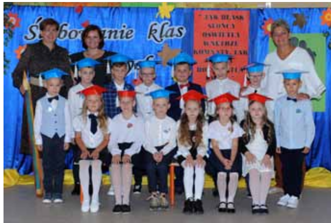
Klasa I B SP Stare Proboszczewice