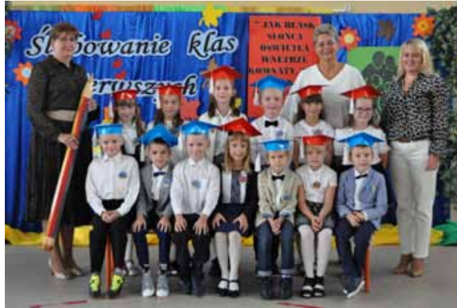
Klasa I A SP Stare Proboszczewice

1 września w szkołach i przedszkolach prowadzonych przez Urząd Gminy Stara Biała nowy rok szkolny 2021/2022 rozpoczęło 1330 młodych mieszkańców naszej gminy. 121 uczniów po raz pierwszy zasiadło w szkolnych ławkach.