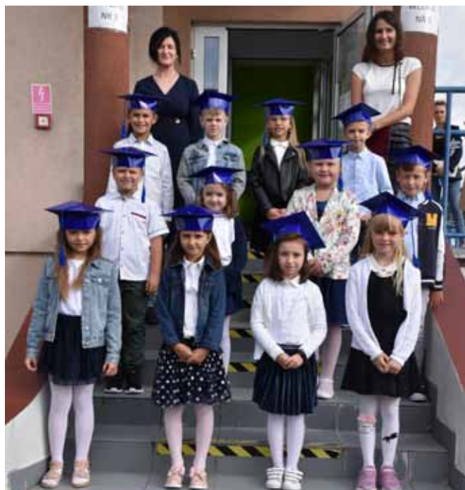
Klasa I SP im. Jana Pawła II Stara Biała