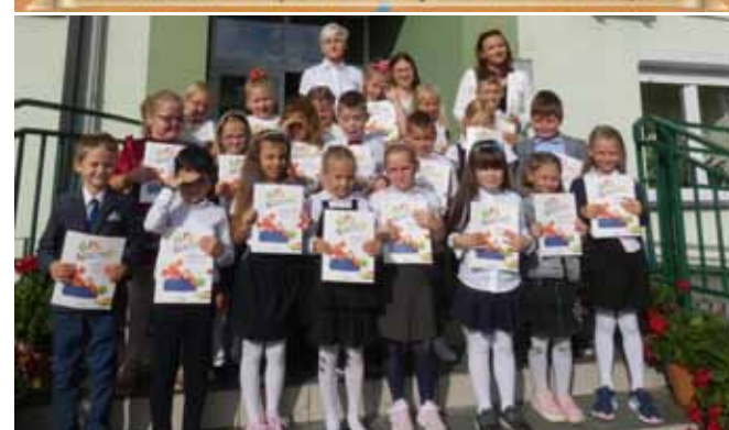
Klasa I SP im. Kornela Makuszyńskiego Wyszyna