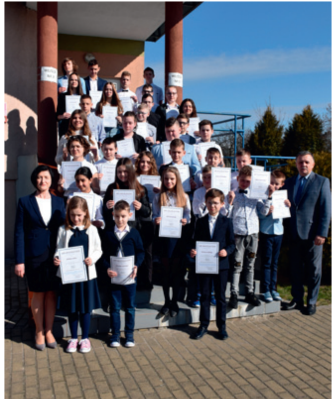
Stypendyści z SP w Starej Białej

Redaguje zespół Gminnego Ośrodka Kultury i Sportu