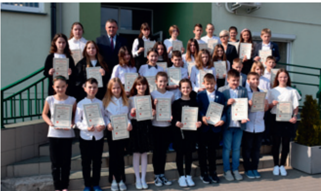
Stypendyści z SP w Wyszynie