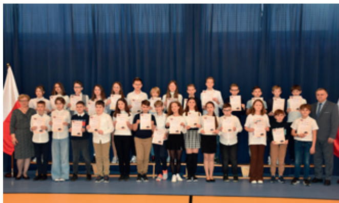
Stypendyści z SP w Maszewie Dużym