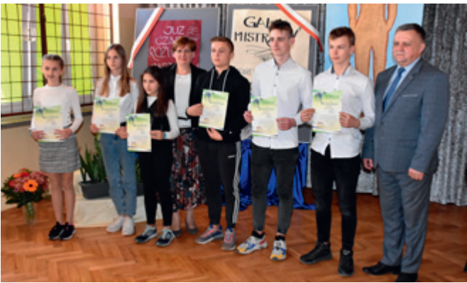
Stypendyści z SP w Starych Proboszczewicach, za osiągnięcia sportowe