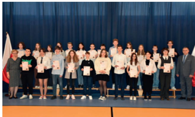
Stypendyści z SP w Maszewie Dużym

W Szkole Podstawowej w Starych Proboszczewicach stypendia za wyniki w nauce otrzymali: