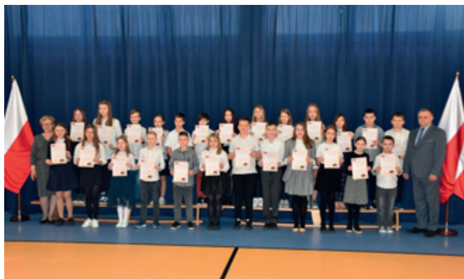
Stypendyści z SP w Maszewie Dużym

W Szkole Podstawowej im. Władysława Stanisława Reymonta w Maszewie Dużym stypendia otrzymali: