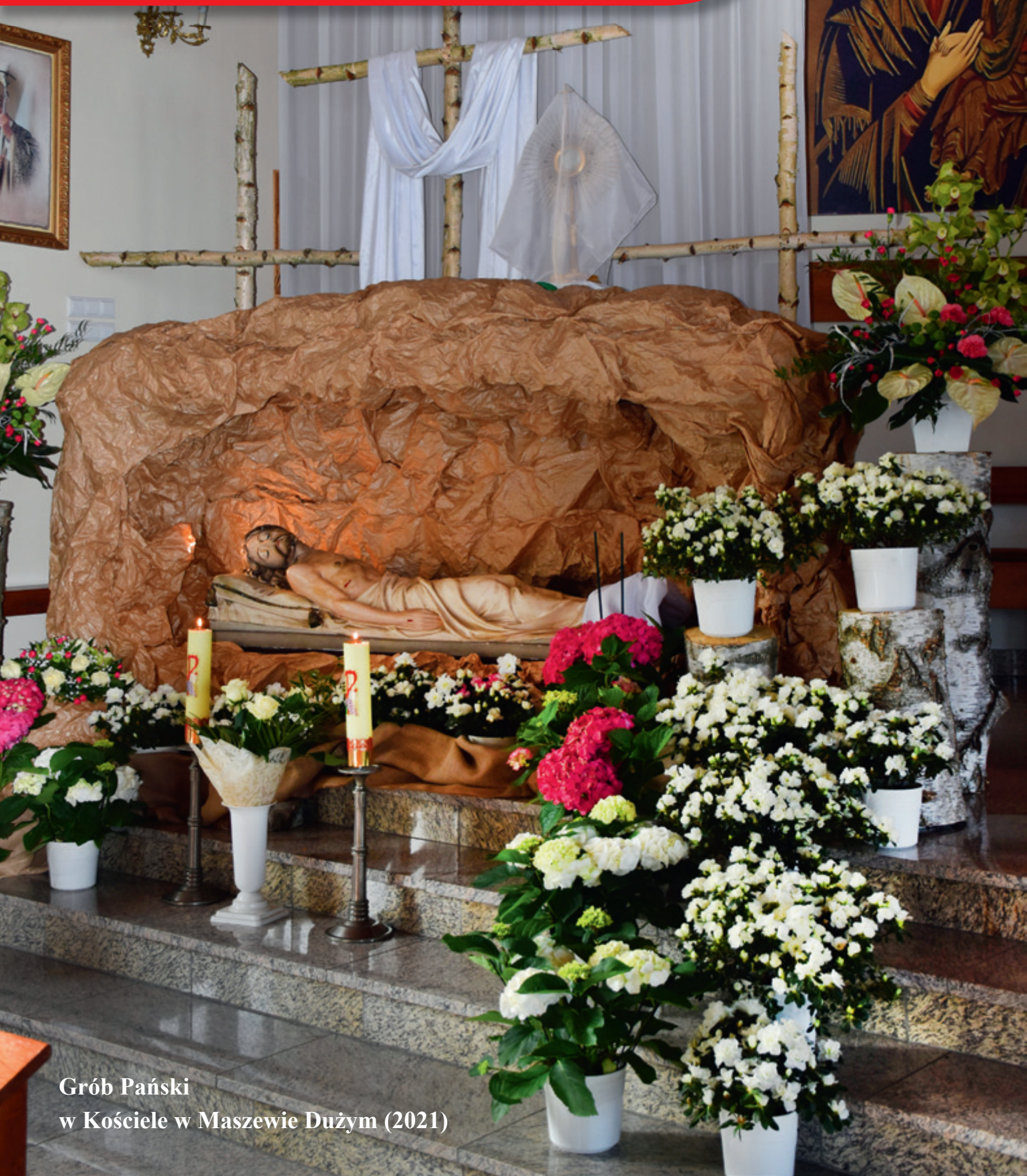
Grób Pański w Kościele w Maszewie Dużym (2021)

Informator Gminy Stara Biała Nr 1(42)/2022