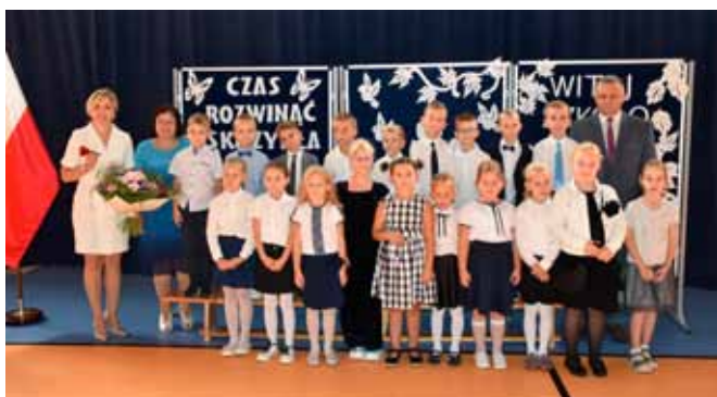
Kl. I B z SP w Maszewie Dużym