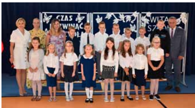
Kl. I A z SP w Maszewie Dużym