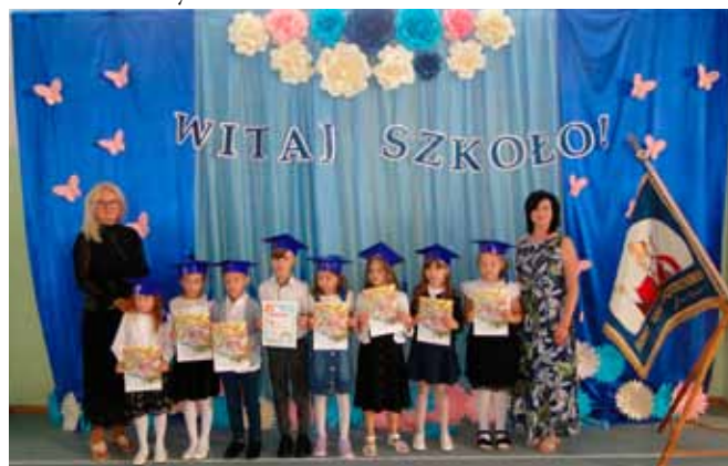
Kl. I z SP w Starej Białej