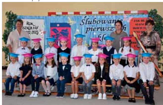
Kl. I A z SP w Starych Proboszczewicach