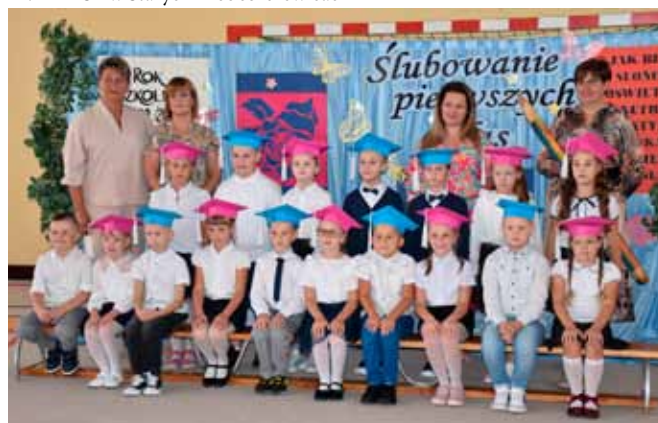
Kl. I B z SP w Starych Proboszczewicach