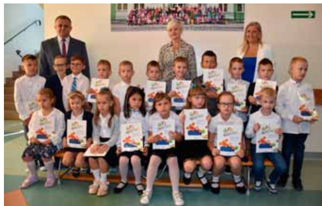
Kl. I z SP w Wyszyńcu

W Szkole Podstawowej w Starych Proboszczewicach do ławek wróciło 267 uczniów. Po raz pierwszy zasiądzie w nich 36 uczniów. W Szkole Podstawowej im. Jana Pawła II w Starej Białej nowy rok szkolny powitało w sumie 139 uczniów – 116 w SP (8 w I klasie) i 23 w oddziale przedszkolnym. Natomiast w przedszkolu w Nowych Proboszczewicach rok szkolny rozpoczął się dla 152 dzieci.