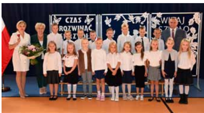
Kl. I C z SP w Maszewie Dużym